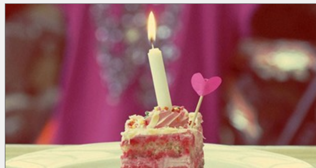
تورته عيد الميلاد - أرشيفية